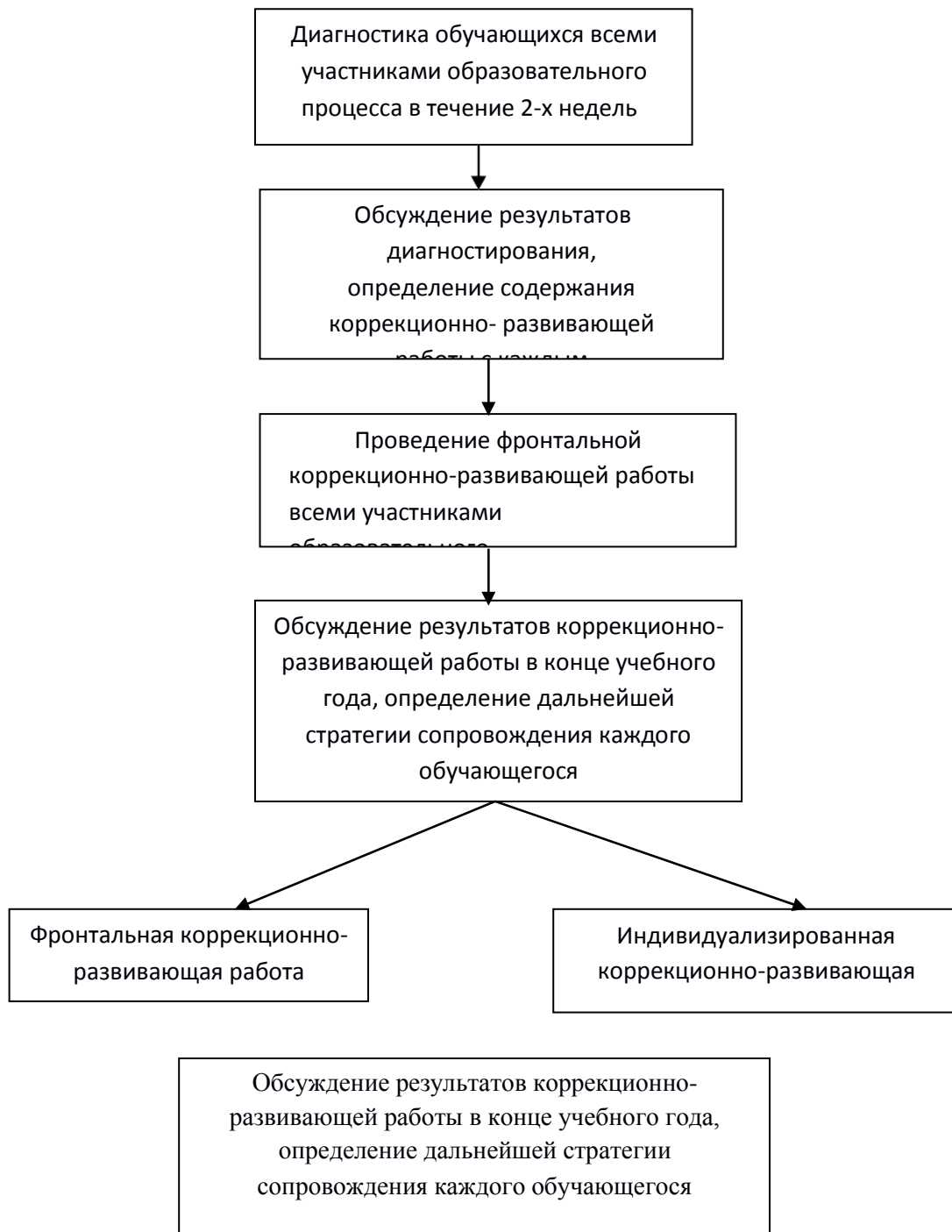
Схема сопровождения обучающихся 1 класса